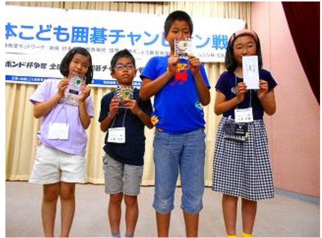
段級位戦B1 1位～3位、敢闘賞