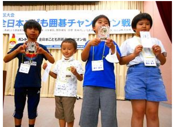
段級位戦C 1位～3位、敢闘賞