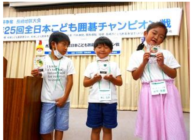
キッズ選手権戦 1位～3位