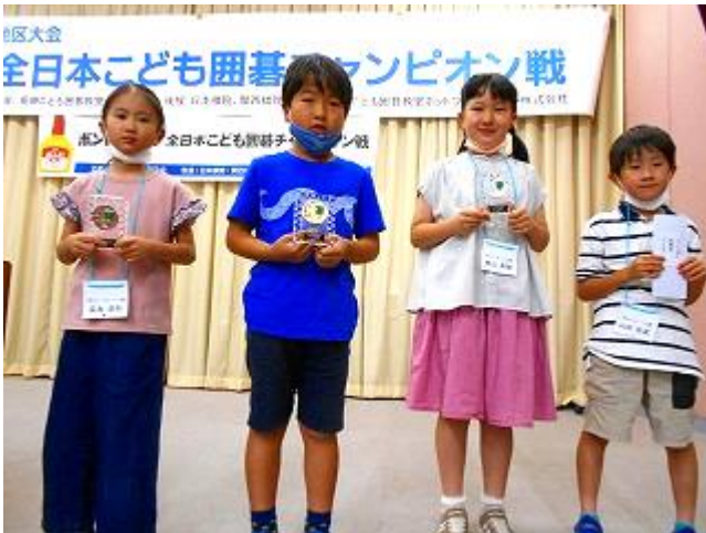
段級位戦B2 1位～3位、敢闘賞