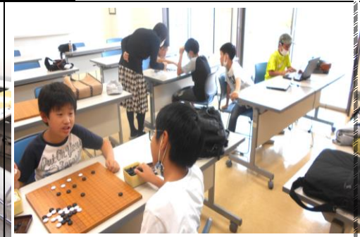
東長崎地区こども囲碁交流教室