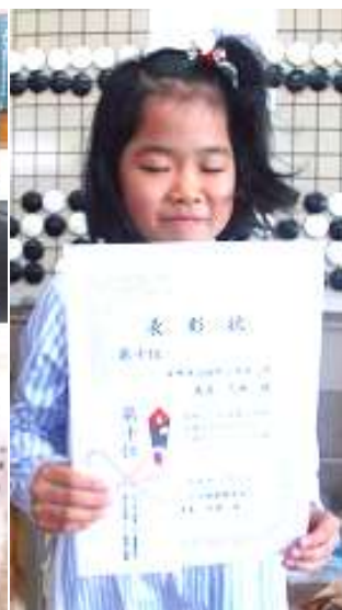
28年11月6日 第4回長崎子ども囲碁十傑戦(高校生まで出場) 左から3位、4位、5位、7位、10位