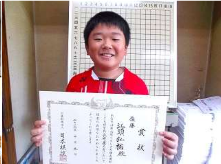
28年10月9日 第6回くらしき吉備真備杯 子ども棋聖戦 長崎県予選会 小学生高学年の部 優勝(全国大会出場権獲得)