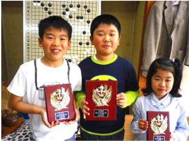
28年4月24日 第37回文部科学大臣杯 朝日少年少女囲碁名人戦県大会 小学生の部 準優勝(全国大会出場権獲得)、第3位、第4位