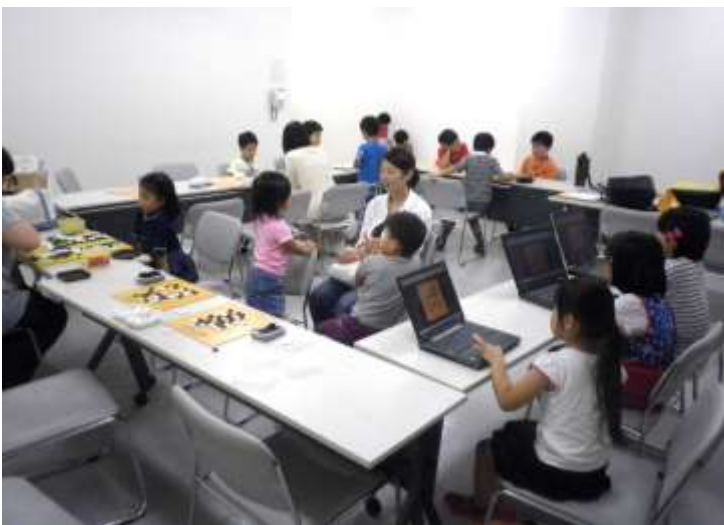
中央公民館会場（市民会館2階）