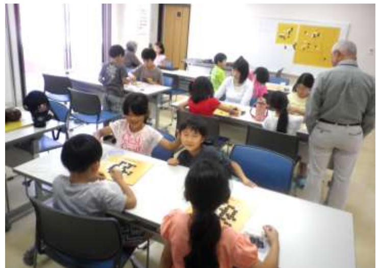
上長崎地区ふれあいセンター会場