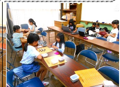
写真4点は日見小学校アフタースクールでパソコンやタブレットを使って囲碁を学ぶ生徒達